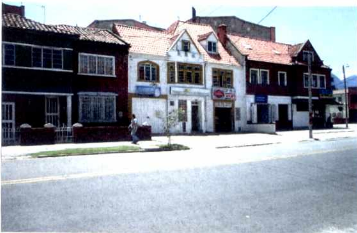
CRITERIOS DE CALIFICACION

✓ Representar en alguna medida y de modo tangible o visible una o mas épocas de la historia de la ciudad o una o mas etapas de la Arquitectura y/o urbanismo en el País.